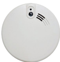
Rook- of hitemelder

"Geeft een alarm bij vorst en spanningsuitval."