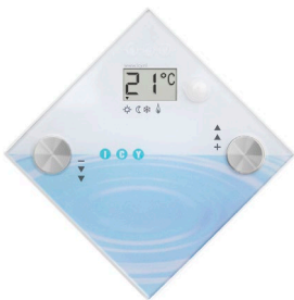
ICY Timer Thermostaat

De basis van het systeem is de ICY1842IN Remote Set. Deze set bestaat uit een ICY Gateway en een Timer Thermostaat. Het systeem communiceert via een lokaal draadloos netwerk dat door de ICY Gateway gegenereerd wordt (ICY-Net). Daardoor is het systeem eenvoudig uit te breiden met andere apparatuur van ICY wanneer dit netwerk eenmaal aanwezig is. Een overzicht van de mogelijkheden ziet u hieronder.